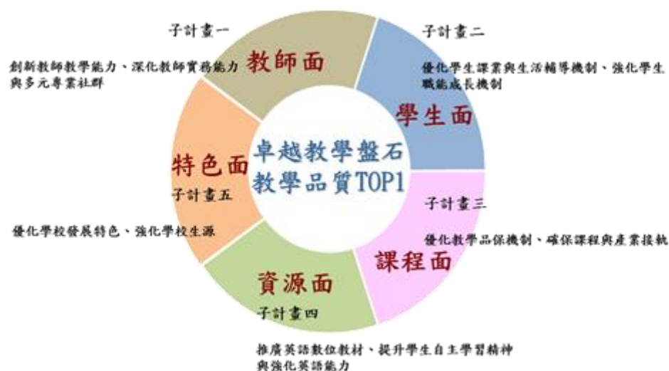
圖 2-1 教學深化-「攜手輔航 共創卓越康寧」架構圖