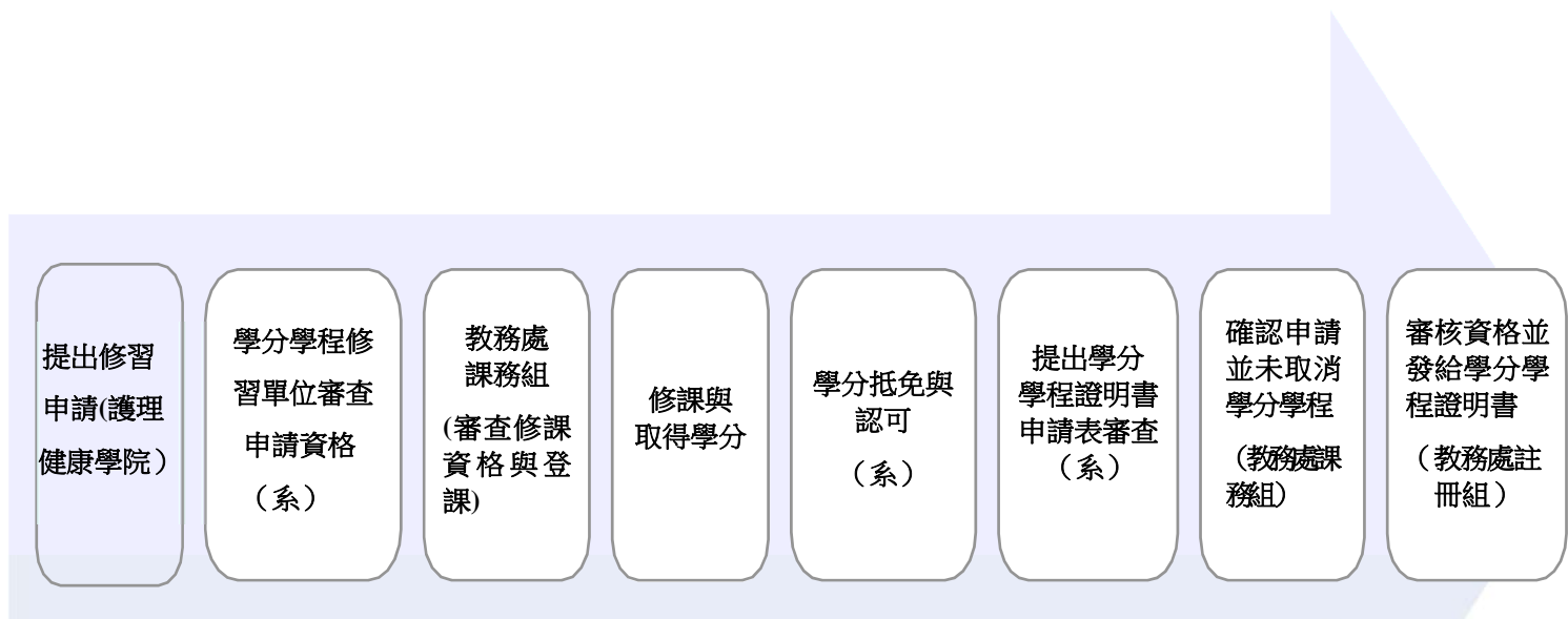
圖 1 【數位科技】微學程修習申請流程圖