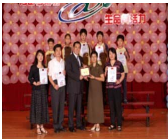
圖 15