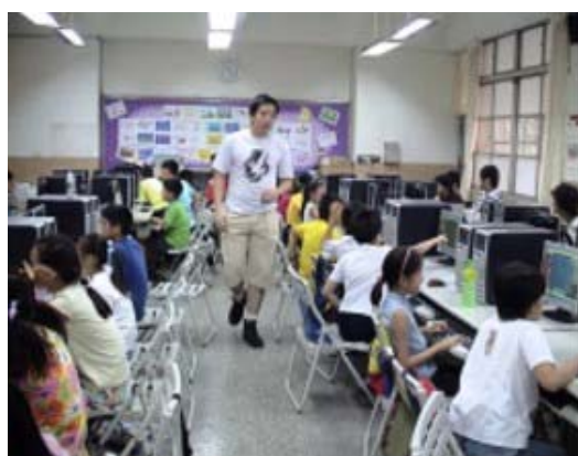
圖 6.敦化國小 RPG 遊戲製作營