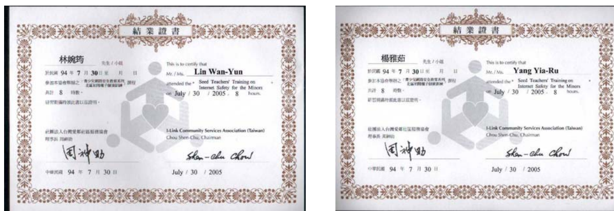
圖 24.參加愛鄰協會《繫上白絲帶·關懷 e 世代》種子師資訓練- 10 位