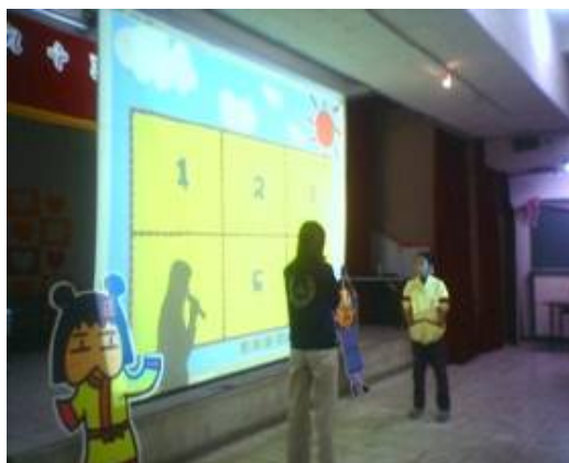
圖 1.民族國小多媒體說故事活動