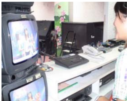
圖 9.敦化國小電視台宣導大專資訊志工服務學習節目錄製與播送