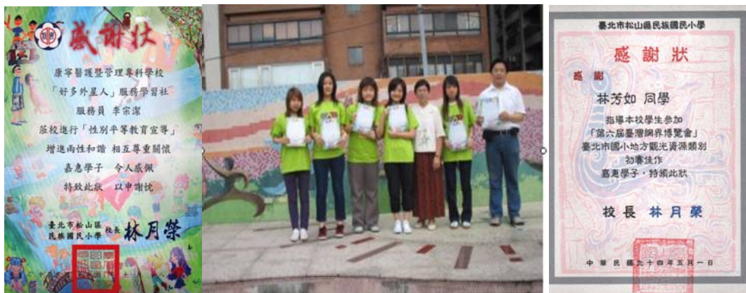
圖 19 接受民族國小校長於全校朝會表揚與感謝