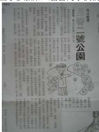
圖 21.民族國小學生在國與日報發表參賽及對大專志工大姐姐的感想