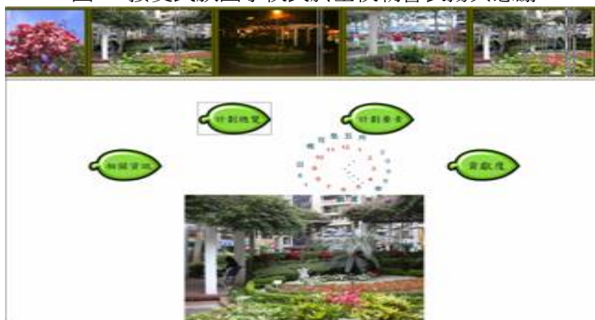
圖 20.民族國小參加第六屆台灣學校網界大賽作品