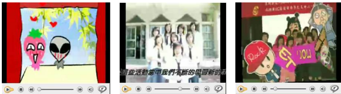
圖 17「草莓也有春天」資訊服務學習宣導短片