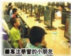
圖 27.自行舉辦社區關懷數位營

數位遊戲營，此次的活動，顧名思義是以社區為主，主要對象為附近社區應屆國三畢業生，以及低收入戶、單親家庭或原住民學童等，有些小朋友雖然居住於繁榮的都市中，但家中並無電腦可以使用，我們藉著這次的活動，讓愛心在社區間走動，活動內容主要是以3D/VR 空間魔法師為主要課程，從畫牆壁到家具擺設，都可以發揮小朋友們的想像空間，以及建造出自己心目中的房子，在製作過程中看到小朋友們都非常期待看到自己建造出來的家，在完成之後，還做了一個成果發表，讓小朋友們互相欣賞自己所建造的房子，每個小朋友都非常開心，就這樣結束了兩小時的活動。