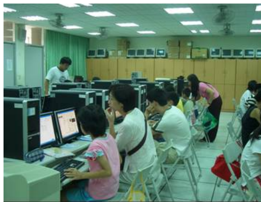
圖 10.舊莊國小 RPG 數位學習-親子之間共同學習