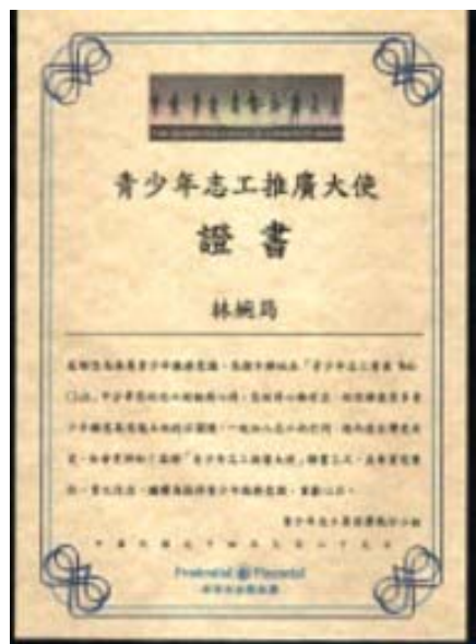
圖 25.參加 SOC 青少年志工推廣大使 - 30 位