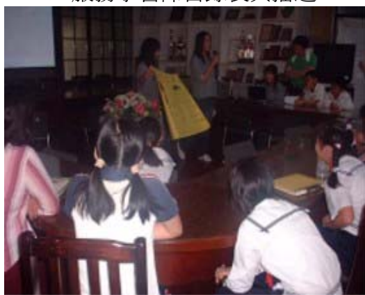
圖 11.敦化國小台灣學校網參賽小尖兵破冰活動