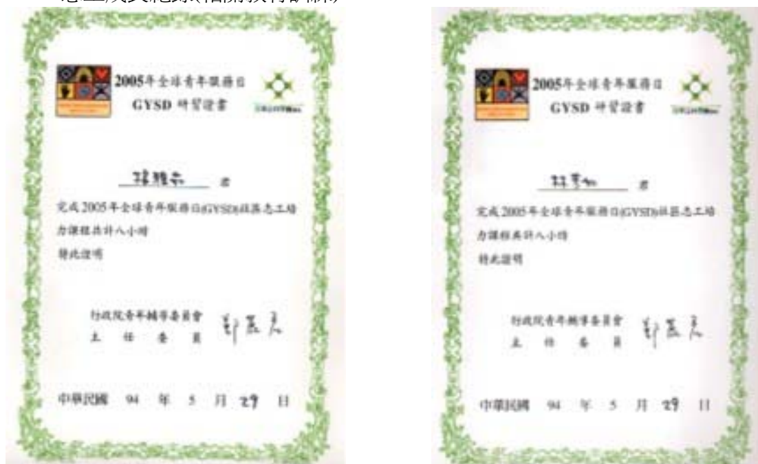
圖 22.參加青輔會 GYSD 培力訓練志工-26 位