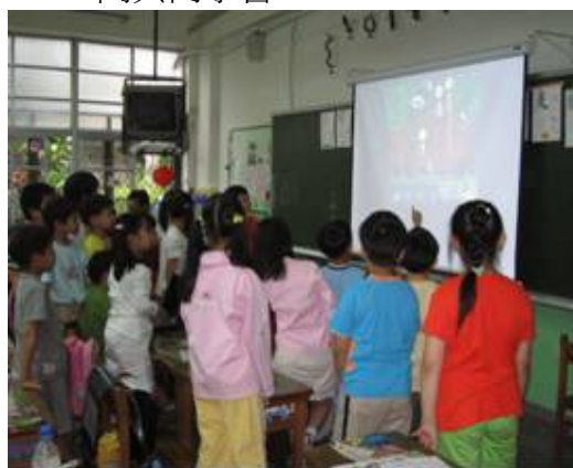
圖 12.敦化國小 RPG 遊戲展示與介紹