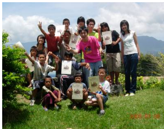
圖 4.加拿國小多媒體訓練營