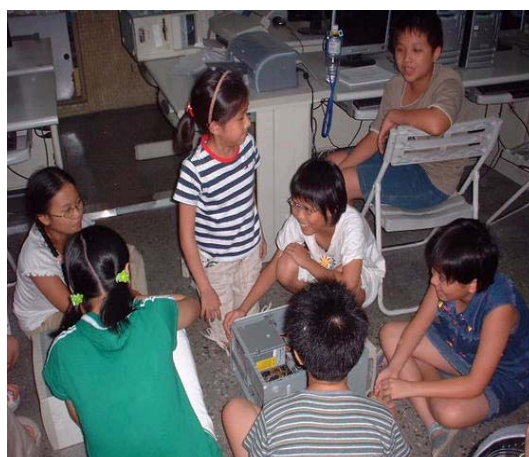
圖 14 敦化國小硬體裝修志工小尖兵訓練第二梯次