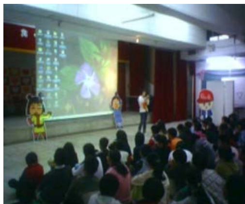
圖 2.民族國小多媒體機智問答活動