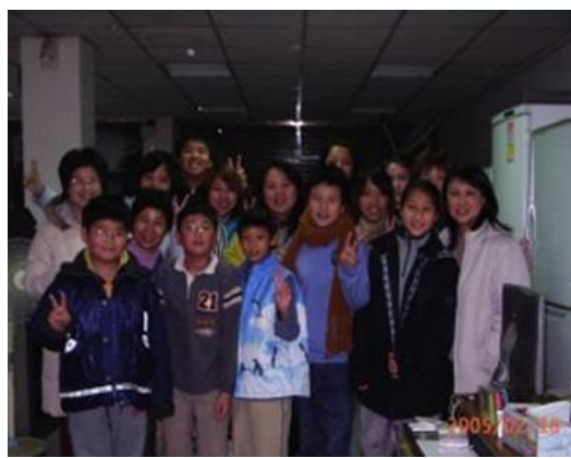
圖 8.民族國小學生、家長及大專志工合影留念