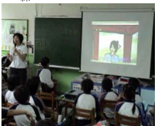
圖 5.敦化國小 e 數梁祝二數寶數位內容教學