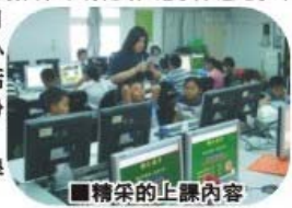
圖 26.參加青輔會教育志工活動

康寧護專學生服務社團主動申請九十六年教育優先區中小學暑期管隊，前往離島學校將貢獻所學，並陪伴小朋友共度有意義的夏天，預計十二日前往北竿塘岐國小馬祖地區夏令營活動結束後，八月份轉往蘭嶼及澎湖，繼續他們暑期教學活動行程。