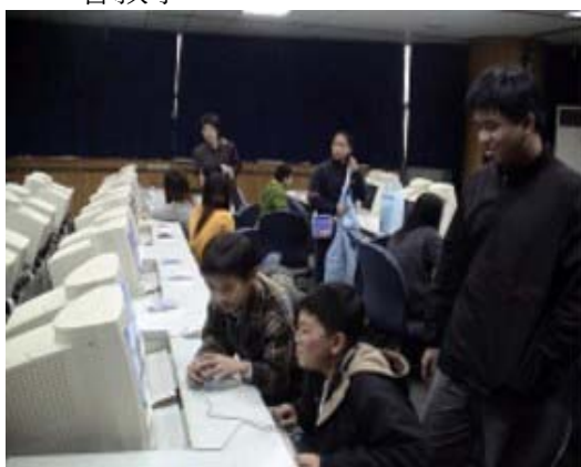
圖 7.民族國小小尖兵至康寧專校資管科