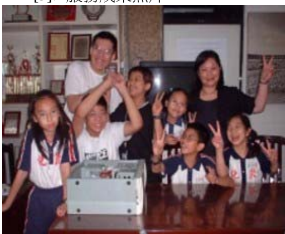
圖 13 敦化國小硬體裝修志工小尖兵訓練第一梯次